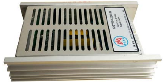
图 1-3 电源实物图