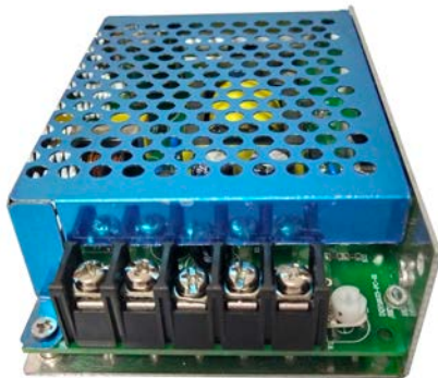
图 1-2 24V/50A 小电源